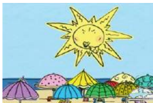
IMAGEM: A Sunny Day, de Gil Alkabetz

PARCERIA PROJETO ALCATEIA – Serviço Educativo FLL e Cine Clube de Viseu PÚBLICO-ALVO Alunos Ensino Pré-Escolar HORÁRIO 10h00, 11h30 e 14h30 DURAÇÃO 50 minutos LOTAÇÃO 60 alunos/3 turmas LOCAL Auditório Maria José Cunha, FLL