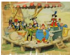
IMAGEM: The Band Concert, de Walt Disney