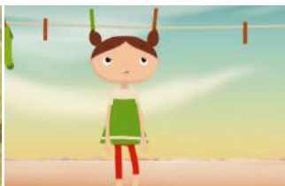
IMAGEM: Balance, de Mara Fradella